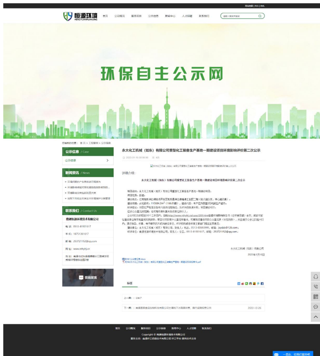
图 2.3-1 征求意见稿网络公示截图

2023年1月16日至2023年2月1日，在南通恒源环境技术有限公司网站（ http://www.nthyhj.cn/case/269.html ）上对建设项目进行了征求意见稿网络公示，公示时间为10个工作日，公示介绍了建设项目情况；污染物产生、防治及排放情况；公众索取信息的方式；公众提出意见的方式和途径及征求公众意见的范围和提出意见的起止时间等，同时附环评报告征求意见稿和公参调查表。公众意见表见表2.3-1，公示截屏见图2.3-1。网络公示期间未收到公众反馈意见。