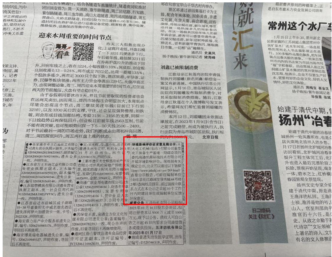
图 2.3-4 第二次报纸公示照片截图