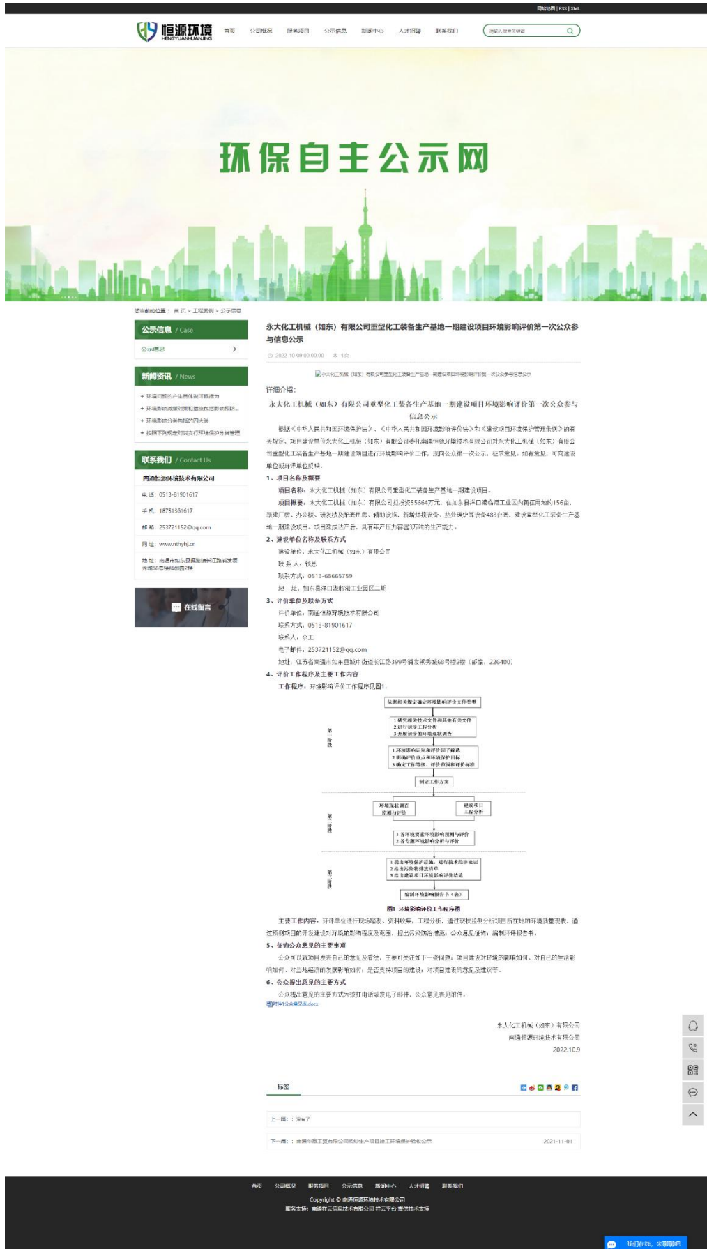
图 2.2-1 首次环境影响评价信息公开截图