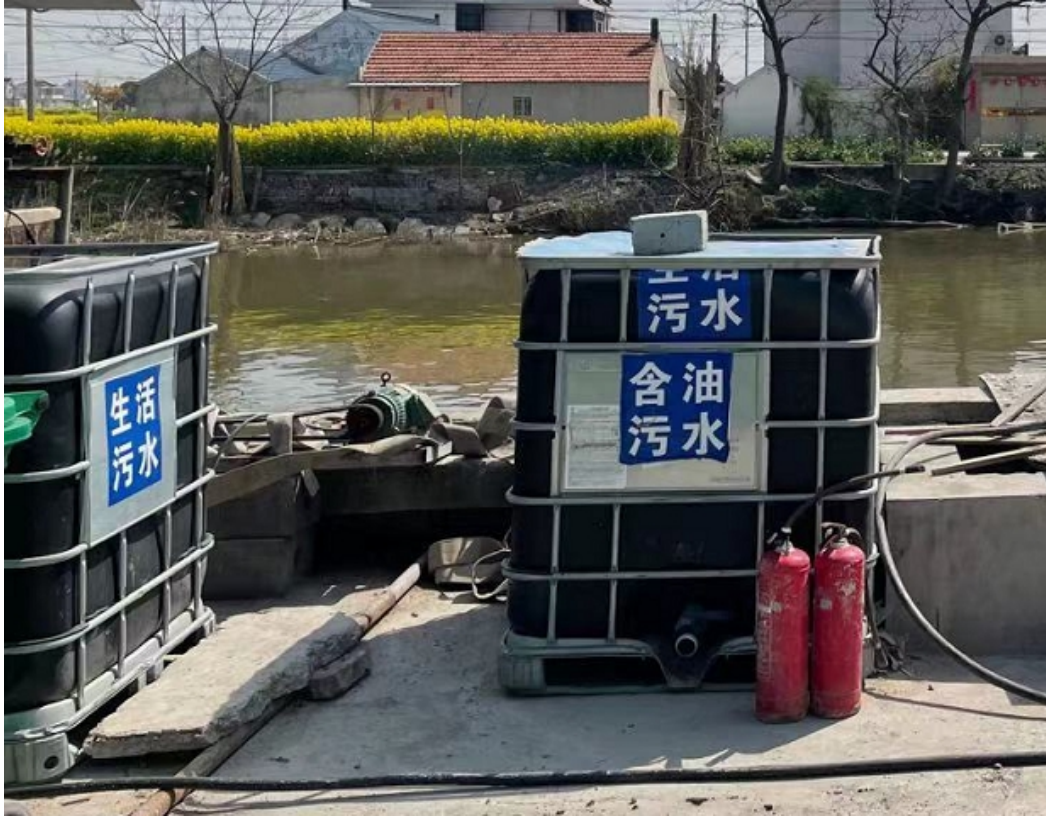
图 4-2 船舶污染物接收设施以及环保标志牌