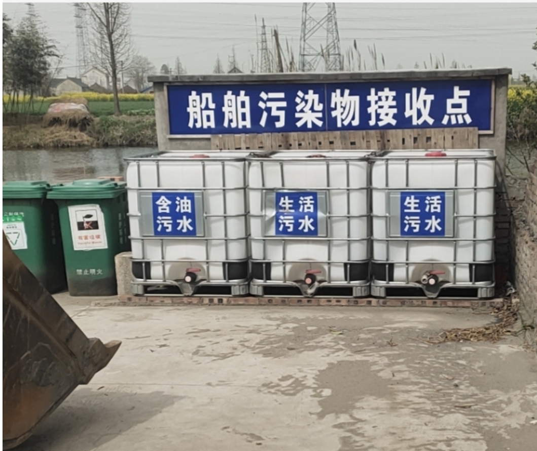
图 4-2 船舶污染物接收设施以及环保标志牌