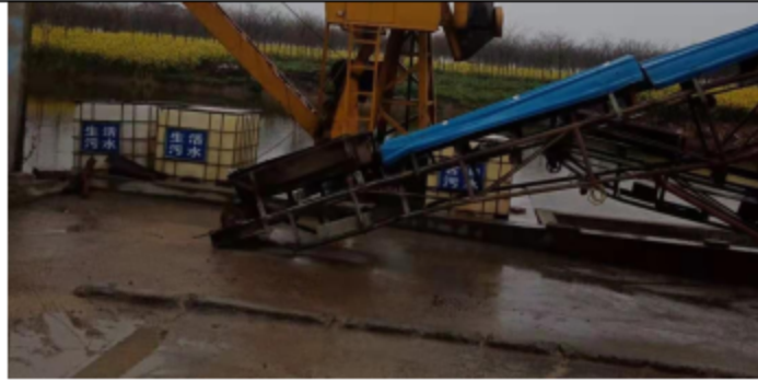
图 4-2 船舶污染物接收设施