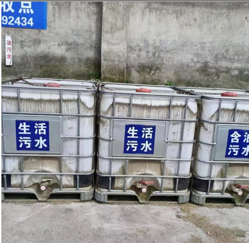
图 4-2 船舶污染物接收设施以及环保标志牌